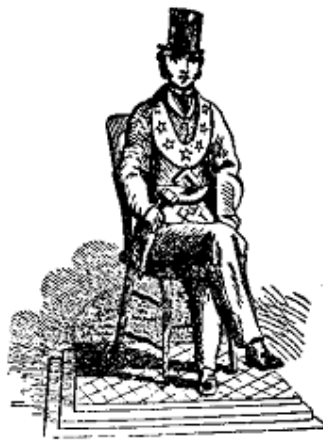
Le Vénérable Maître

Le Rite d'York est très riche en cérémonies aussi bien intérieures qu'extérieures : pose de la première pierre d'un édifice, dédicace d'un temple, dédicace de bannière, anniversaire de loge, enterrements, etc. De plus, les installations de Vénérable Maître peuvent souvent être faites en environnement profane. Il est à noter que dans ce cas, le cérémonial obéit à une procédure particulière occultant une partie du rituel et spécialement la partie confidentielle de l'installation où sont révélés les signes et secrets de Maître installé.